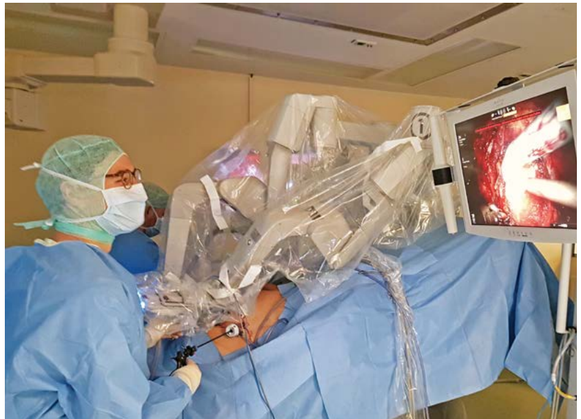
Patientenlagerung und Assistenz während einer Da Vinci®-assistierten Prostatektomie

Tastuntersuchung (DRU) erfolgen. Sollte sich im Rahmen einer PSA-Untersuchung die Indikation zur Stanzbiopsie stellen, so erfolgt in der Regel die Überweisung zum Spezialisten. Eine ASS-Therapie kann bei Biopsien in der Regel bei geringem, aber gut vertretbarem Risiko fortgeführt werden.