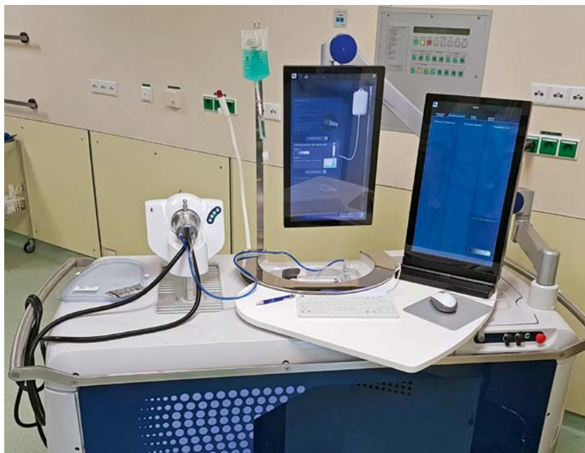
Die Focal One-Arbeitsstation zur Durchführung einer fokalen Therapie mittels HIFU

Für die Aktive Überwachung spielt die MRT eine große Rolle, da hierdurch eine bessere Risikostratifizierung und der Ausschluss größerer multifokaler Tumoren erreicht werden kann. Dennoch besteht bei der Aktiven Überwachung, insbesondere bei weit gefassten Einschlusskriterien, ein höheres Risiko für das Auftreten von Metastasen, das durch eine präzisere Risikostratifizierung per MRT möglicherweise reduziert werden kann. Dies sollte, insbesondere bei der Therapiewahl bei