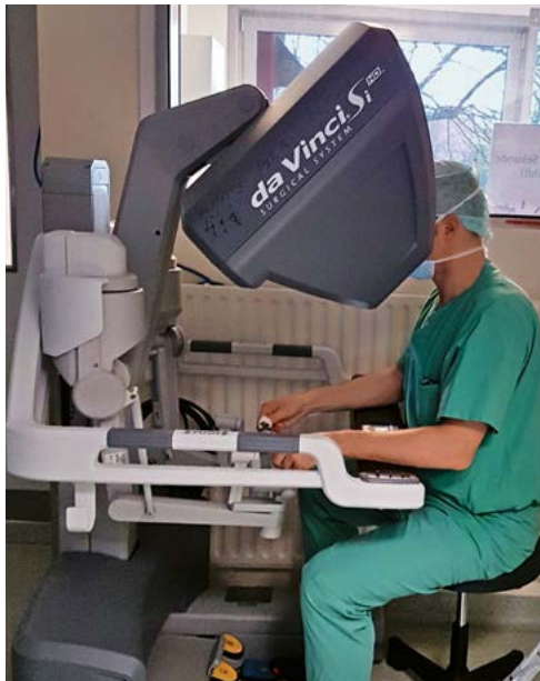
Operateur während der Da Vinci®-Prostatektomie