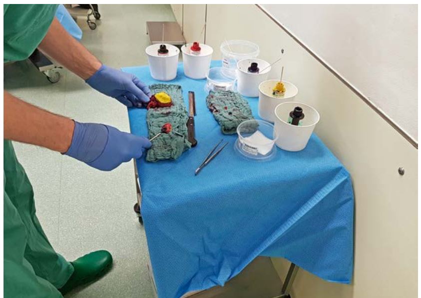
Aufarbeitung eines Prostatapräparates nach Prostatektomie